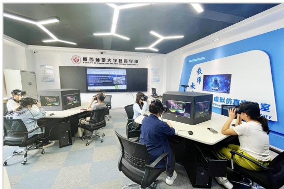
教育技术学专业虚拟仿真实验室