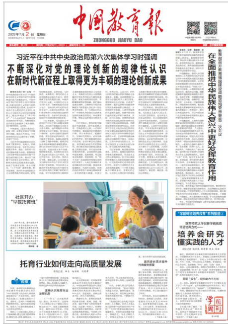
《中国教育报》对学前教育专业“实践-研究”型人才培养模式进行报道