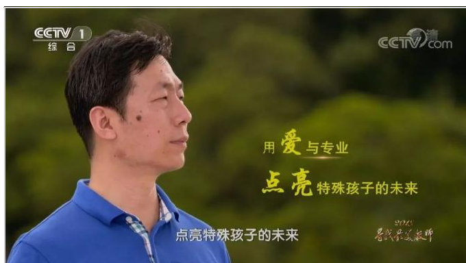
1996级特殊教育专业毕业生、全国模范教师、 全国最美教师申承林参加教育部教育家精神宣讲

未来，学部将以“打造西部教育研究高地，跻身国际一流教育学科行列，培养高层次教育人才，服务国家与区域教育发展”为目标，以一流学科建设为龙头，立足西部，面向全国，放眼全球，不断增强对西部教育的辐射力和影响力，努力成为“我国西部教育研究的重镇、卓越教师和拔尖创新人才培养的摇篮”，为学校加速发展高质量发展作出应有的贡献。