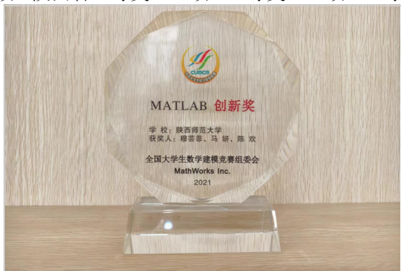
学院获得 Mat lab 创新奖

以赛促进，实践育人。 学院构建了依托实践课程、实训中心和孵化基地三个平台，通过理论、项目、基地和竞赛四种方式，参加师范生教育教学技能大赛、数学建模大赛、全国大学生数学竞赛、密码挑战赛和市场调查与分析大赛五种数学学科竞赛的“三平台、四方式、五竞赛”的实践教学体系。学生在各类国家级学科竞赛取得突出成绩。在全国大学生数学建模竞赛中，近五年共获得国家一等奖10项、二等奖27项，陕西省一等奖242项、二等奖278项；其中2021年获得全国本科组唯一的“Matlab 创新奖”。在全国大学生数学竞赛中，近五年共获得国家一等奖1项、二等奖4项、三等奖6项，陕西省一等奖326项、二等奖508项、三等奖697项。