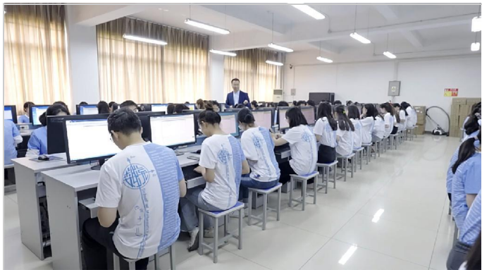
学院计算机综合实验室

数学与统计学院自创建以来,致力于人才培养与科研创新,服务国家经济社会发展与战略需求,现已成为国内具有重要影响的数学研究中心和人才培养基地。学院由数学系、信息与计算科学系、统计学系、公共数学教学部及基础数学研究中心、数学与交叉科学研究中心、数学研究所和数学教育研究所组成,设有数学与应用数学、信息与计算科学和统计学三个本科专业,形成了本、硕、博完整的人才培养体系。学院现有全日制本科生 1454 人,硕士、博士研究生 496 人,公费师范生在职攻读教育硕士 798 人。现有教职工 133 人,其中专任教师 109 人。专任教师中,教授 44 人、副教授 47 人,具有博士学位的教师 106 人。教师中享受国务院政府特殊津贴专家 5 人,入选国家级人才计划 2 人,入选教育部各类人才计划 6 人次,入选陕西省各类人才计划(含教学名师) 21 人次。