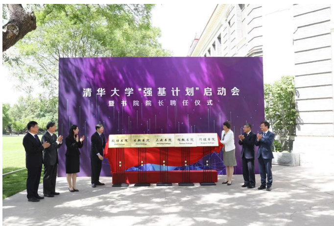
清华大学“强基计划”启动会暨书院院长聘任仪式

学校在不断探索创新人才培养模式的过程中，切实做到因材施教、分类培养。在通识教育实验区新雅书院、全学程宽口径大类培养、“清华学堂人才培养计划”等探索基础上，进一步扩大从试点到推广的改革半径，更大力度地投入本科人才培养，让更多的学生