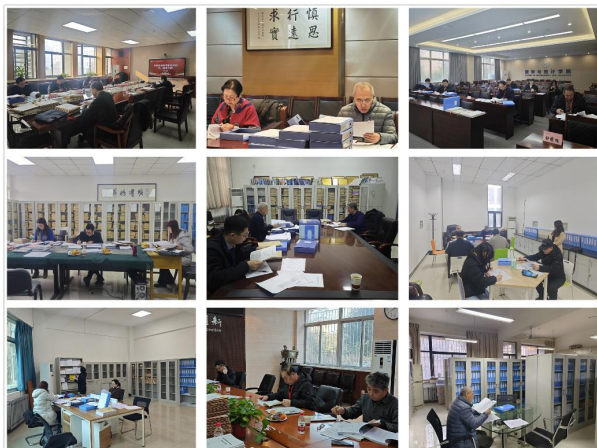
专家查阅资料环节

本轮预评估共组建了七个专家组，专家由学校本科教学督导委员会资深督导和各本科教学单位教学副院长组成。专家组按照我校第一轮预评估工作要求，通过查阅教学制度文件、教学档案材料以及与教师代表、学生代表座谈、党政领导班子访谈等方式，对21个本科教学单位进行了全面检查，并进行了综合抽查。本轮预评估主要查找了各学院在教学改革与建设、教学管理与运行等方面存在的问题与短板，并向各学院分别反馈了具体问题与意见建议。