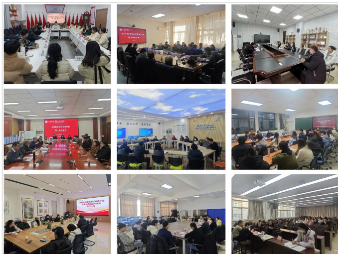
教师座谈、学生座谈环节