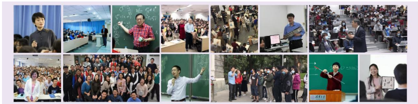
优质课程示范引领

程组织方式，推动“大+小”课堂结合，建设优质小班课程，进一步加强师生互动，提升教学品质。建立各类型课程的“荣誉体系”，以标杆课程、精品课程、通识荣誉课程建设为抓手，推动优质课程示范引领。33门具有引领性和示范性的优质标杆课程全部开放观摩，29门高定位、高挑战度的通识课程获评通识荣誉课，281门本科精品课程覆盖40个院系。2020年，全校共58门课程通过首批国家级一流本科课程认定，数量居全国高校首位。