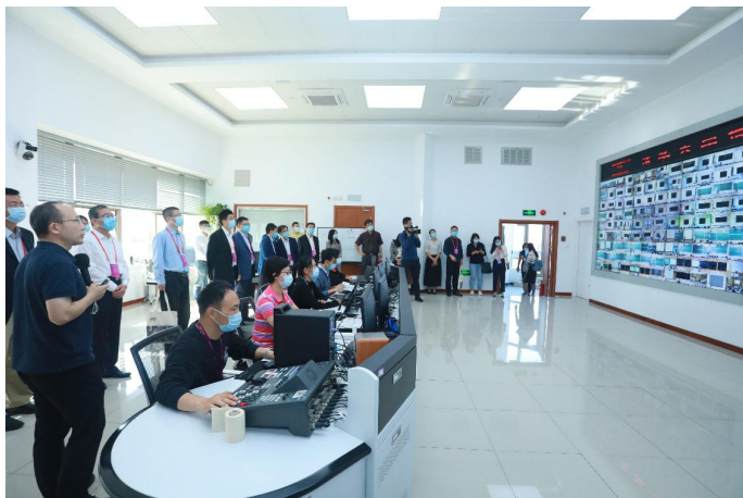
本科教育教学审核评估专家组参观调研在线教学指挥中心

2021年底，《清华大学2030高层次人才培养方案》作为学校三个中长期战略规划之一正式发布。方案坚持立德树人、质量优先、改革创新、担当作为，重点实施“统筹推进全方位思政体系、打好本科生全面成长的人生基础、加快研究生教育改革发展、推进本博贯通培养、坚持德智体美劳全面发展、推进融合式教学、大力推进学风建设、加强育人环境及技术支撑体系建设”等八方面任务。学校正以2022年举行的第26次教育工作讨论会为契机，积极推动凝聚共识、推进方案实施。